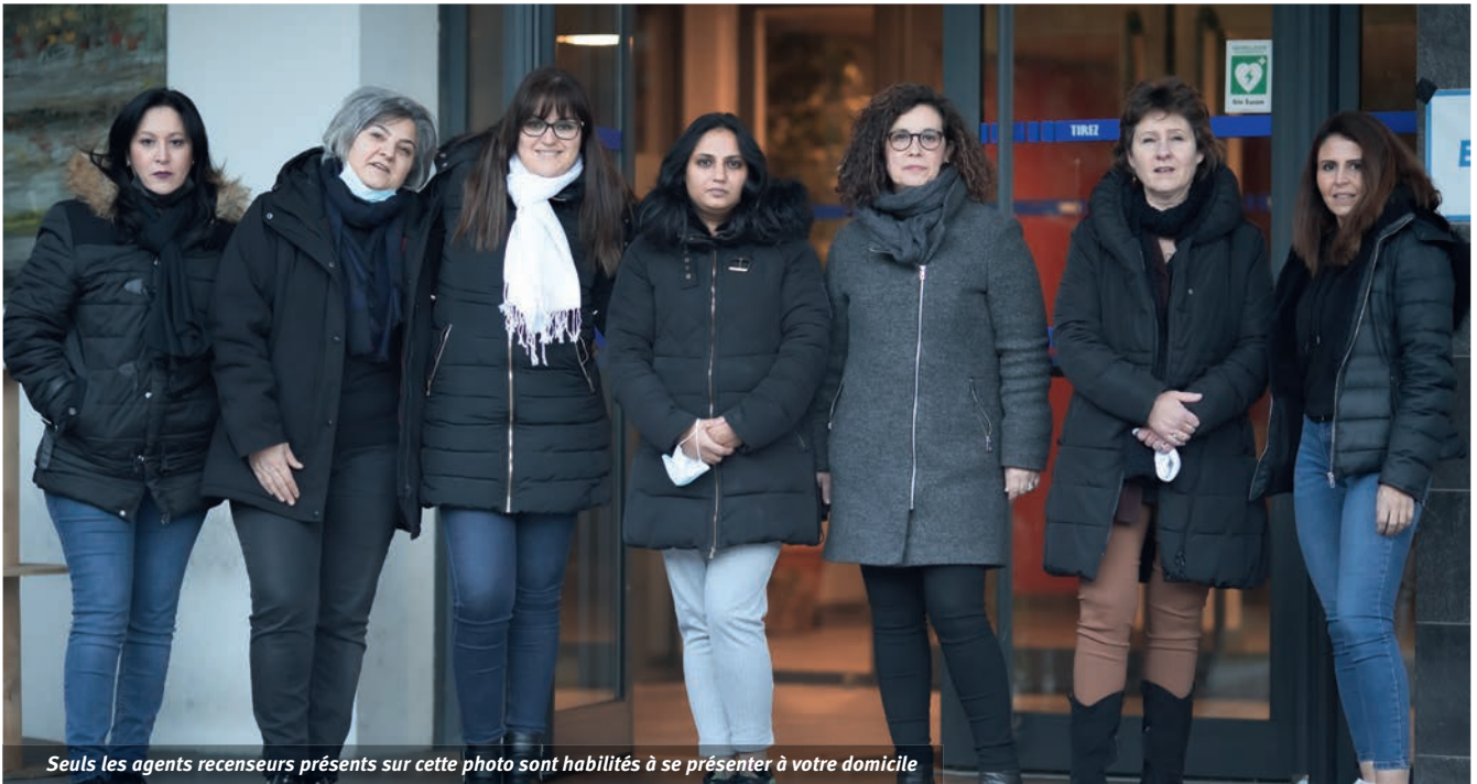
Seuls les agents recenseurs présents sur cette photo sont habilités à se présenter à votre domicile

Organisé par l'INSEE*, le recensement de la population aura lieu du 20 janvier au 26 février 2022. Livry-Gargan magazine vous donne toutes les informations utiles à connaître si vous êtes parmi les 8% de français recensés.