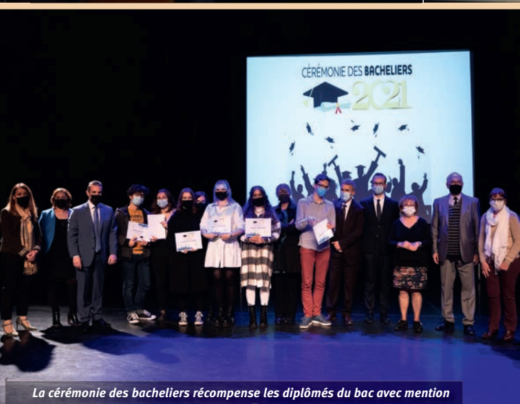
La cérémonie des bacheliers récompense les diplômés du bac avec mention