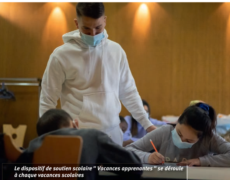
Le dispositif de soutien scolaire " Vacances apprenantes " se déroule à chaque vacances scolaires