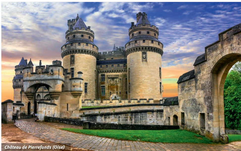
Château de Pierrefonds (Oise)

Soucieuse de leur bien-être, la Ville propose aux Livryens de plus de 60 ans un large programme d'animations mensuelles. Des sorties pour s'aérer et découvrir, des animations pour se divertir, des conférences pour bien vieillir et des moments de convivialité intergénérationnels... De quoi rester en forme et s'occuper tout au long de l'année. Découvrez le programme du mois en cours.