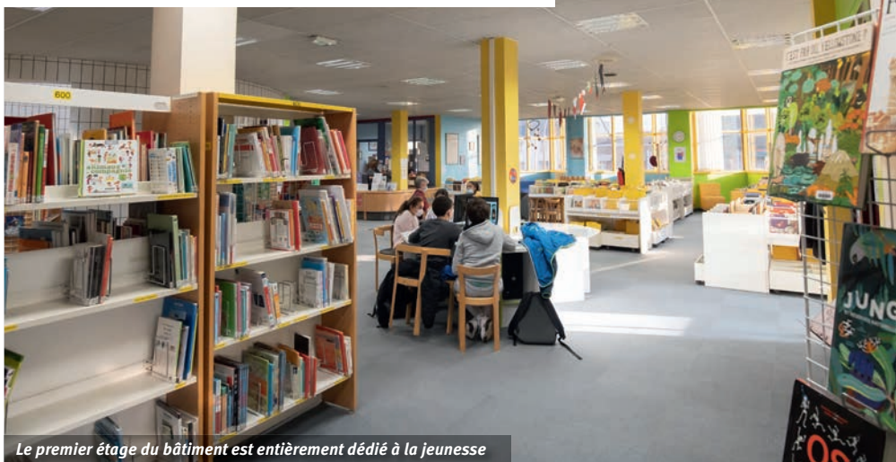
Le premier étage du bâtiment est entièrement dédié à la jeunesse

À proximité de la mairie, la bibliothèque René Cassin offre toute l'année un accès à la culture sans pareil. Véritable havre de paix, ce lieu intergénérationnel est gratuit et ouvert à tous. Rapide tour d'horizon des services et nouveautés que propose l'établissement.