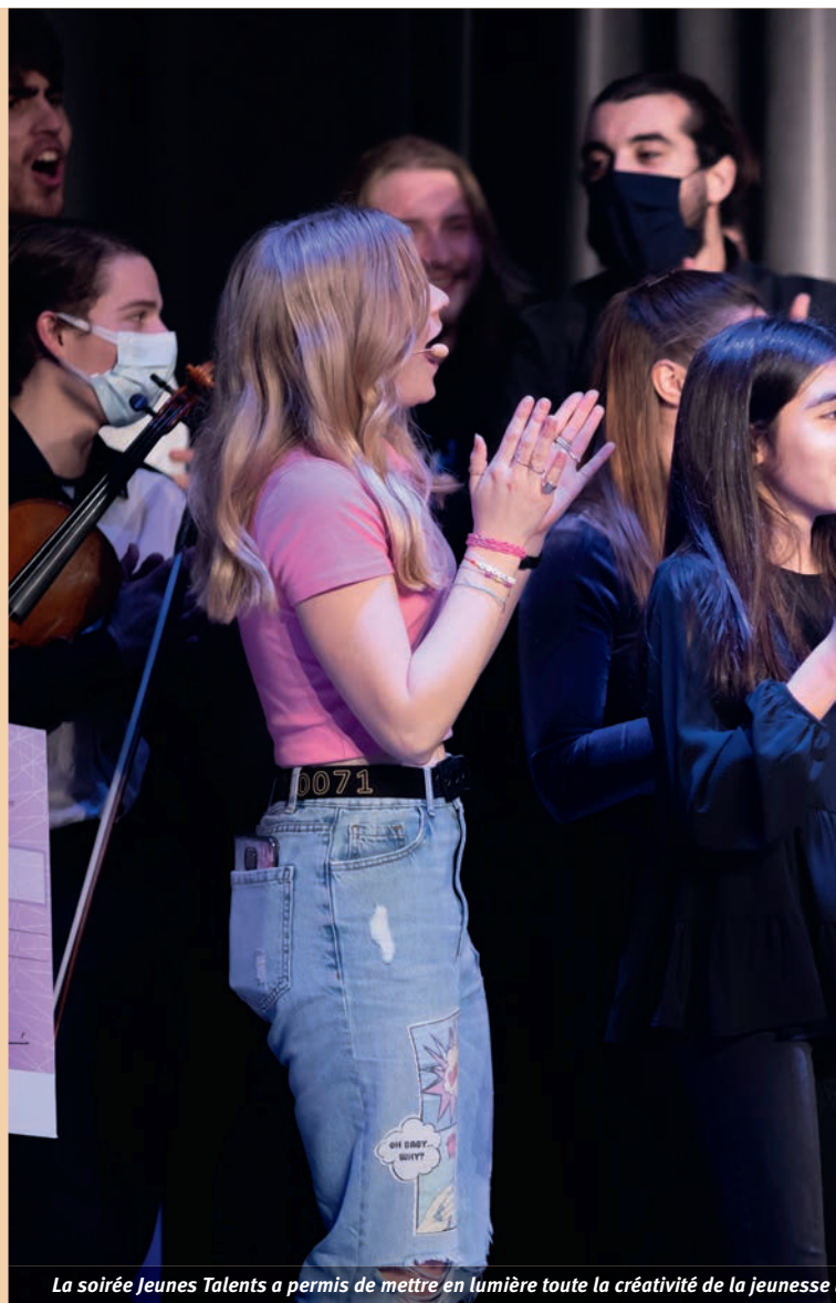
La soirée Jeunes Talents a permis de mettre en lumière toute la créativité de la jeunesse

Chaque année, la cérémonie des bacheliers est l'occasion de féliciter et de mettre en valeur les lauréats du baccalauréat ayant obtenu leur diplôme avec mention. En 2021, ce fut le cas pour 137 jeunes Livryens qui ont été reçus à l'Espace Jules Verne, le 19 novembre dernier. Dans une ambiance festive, les jeunes diplômés y ont été chaleureusement félicités par le maire avant de se voir remettre un chèque cadeaux. Un geste destiné à valoriser l'excellence dont ils ont su faire preuve tout en les incitant à poursuivre avec la même réussite leur scolarité.