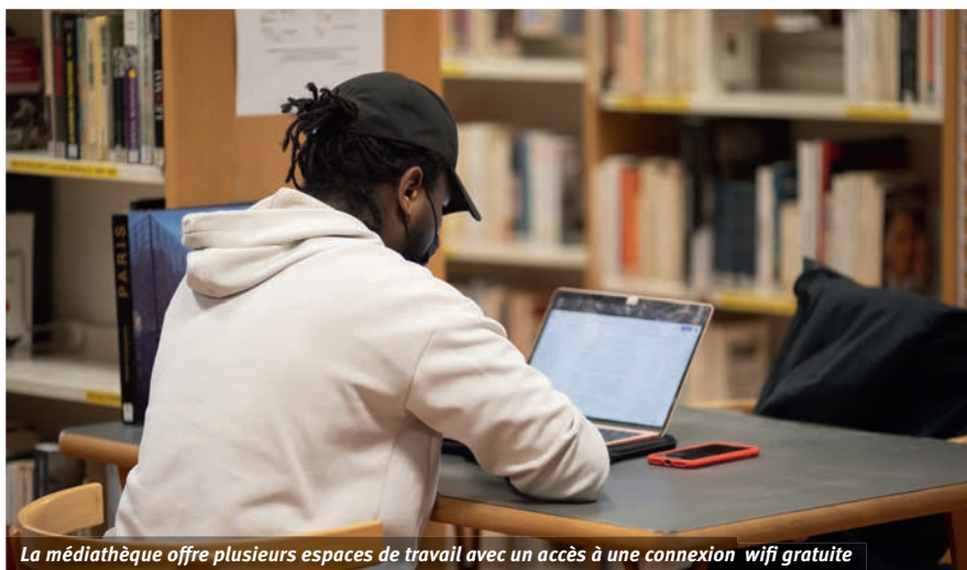
La médiathèque offre plusieurs espaces de travail avec un accès à une connexion wifi gratuite