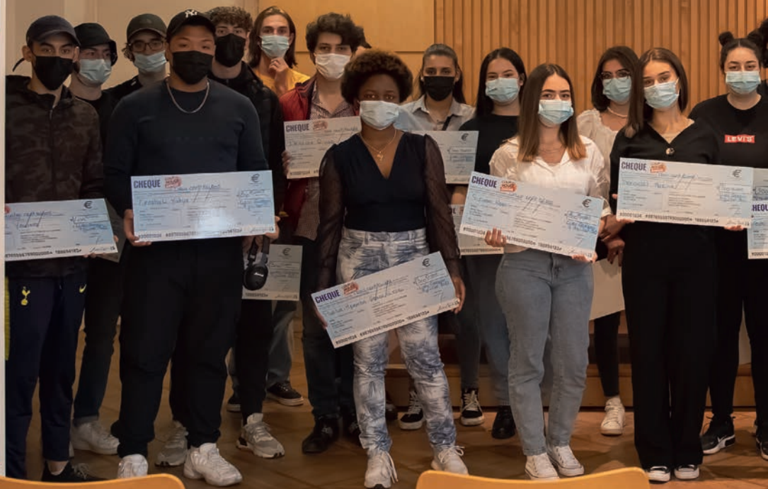
Le dispositif "Coup de pouce jeunesse" permet à de nombreux jeunes livryens de réaliser un projet en contrepartie d'heures de bénévolat

Diverses et variées, toutes ces actions ont le même but : créer des opportunités leur permettant de développer leurs connaissances, leurs aptitudes et leurs compétences. Portée par le service jeunesse, cette politique a été voulue comme adaptée à leurs attentes, mais aussi partagée, en impliquant les jeunes eux-mêmes.